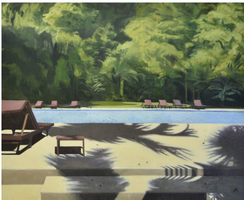
Yann Lacroix The bliss - 2017 huile sur toile - 195 x 240 cm

6 passage des Gravilliers 75003 PARIS P + 6 37 34 99 78 T + 9 83 73 34 64 mercredi - samedi 14h - 19h www.underconstructiongallery.com underconstructiongallery@gmail.com #ucgallery